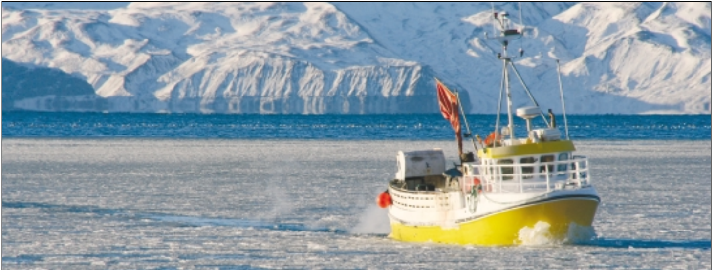
Ásgeir PH öslar krapaisinn á leið inn í Húsavíkurhöfn í hörkufrosti í vikunni.