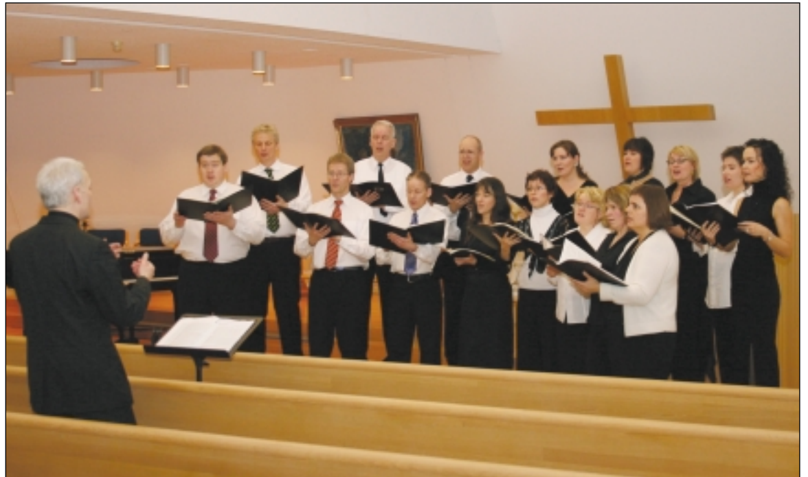
Kammerkór Norðurlands í Blönduóskirkju. Og eins og sjá má eru margir þekktir þingeykskir söngvarar í kórnum.

Og hann hvatti tónlistarunnendur til að mæta á tónleikana á þriðjudagskvöldið. „Því þó ég segi sjálfur frá, þá er þetta skrátt góður kór og söngskráin að mörgu leyti merkileg og í raun ótrúlega fjölbreytt, frá þjóðlögnum og yfir í nýrri verk.“