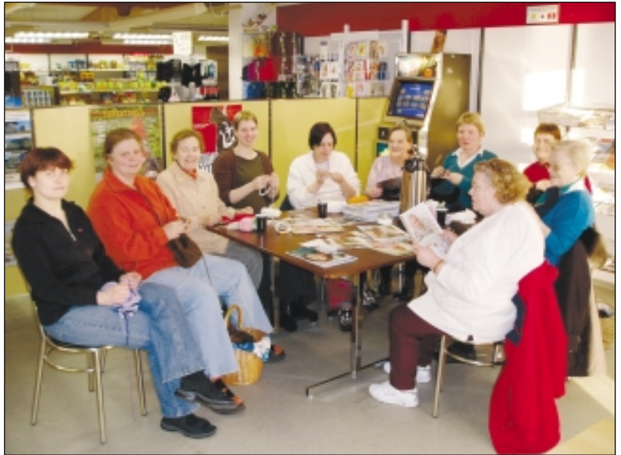
Ens og sjá má er ekkert kynslóðabil í prjónakaffinu á Bakka

Verslunin Bakki á Kópaskeri hefur hrundið af stað þeirri nýbreytni að bjóða til prjónakaffis á staðnum. Öllum er velkomið