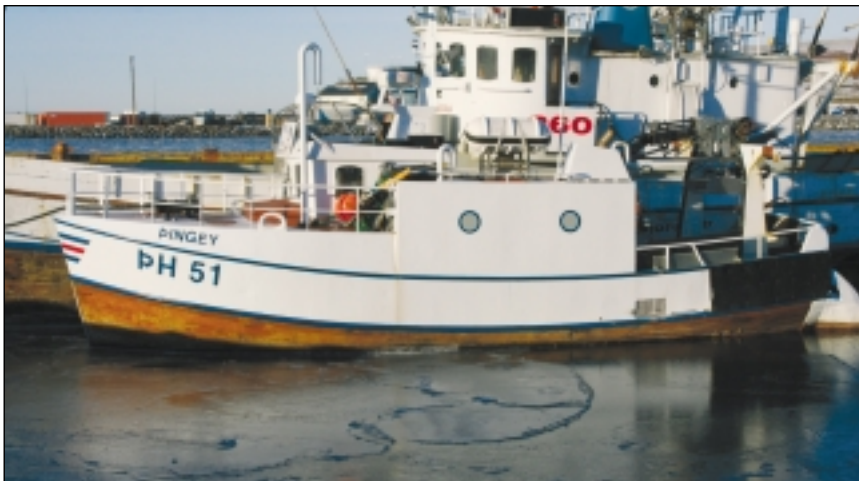
Pingey er víðar að finna en í Skjálfandafljóti. Hér er t.d. Pingey í Húsavíkurhöfn.