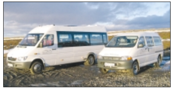
Rúnar hefur verið að bæta við bílaflokk og hér eru nýjustu farkostirnir.

Og þetta á við um fjölmörg fyrirtæki og margvíslega starfsemi á svæðinu. Margir hafa um skeið verið að leggja mjög hart að sér í miklum þröngingum,